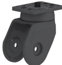
Rangka nilon yang sangat ringan