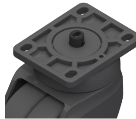
Rem yang dioperasikan dengan central locking system